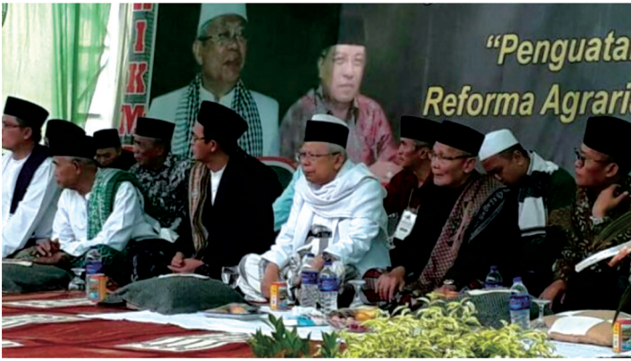
Gambar 4. Pra-Munas Nahdlatul Ulama yang Mengangkat Topik Reforma Agraria, Lampung 2017.

Masuknya kembali isu agraria utamanya reforma agraria di tubuh NU struktural justru langsung dari atas (PBNU). Tidak berlebihan jika dikatakan bahwa hal ini tidak terlepas dari peran salah satu Ketua PBNU, K.H. Imam Aziz yang memiliki latar belakang akademisi dan aktivis (Aprianto 2017). Ia adalah salah satu pendiri lembaga Syarikat (Masyarakat Santri untuk Advokasi Rakyat) yang memiliki pengalaman panjang dalam penelitian, advokasi, dan rekonsiliasi atas kasus-kasus kekerasan di masa lalu. Sebagai ketua PBNU ia hadir dalam memberikan dukungan perjuangan warga di wilayah konflik seperti di Setrojenar Kebumen tatkala warga mendapatkan perlakuan kekerasan dari TNI yang tanahnya di wilayah pesisir diklaim sebagai wilayah pertahanan. Demikian juga kehadirannya di beberapa pengajian yang diselenggarakan oleh para warga yang memperjuangkan tanahnya di Kulonprogo yang mengalami penggusuran karena adanya rencana pembangunan bandara; di tenda perjuangan ibu-ibu Rembang, dan sebagainya.